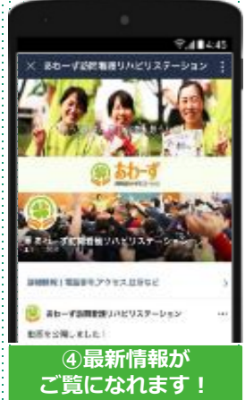
④最新情報をご覧になれます!