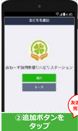
②追加ボタンをタップ