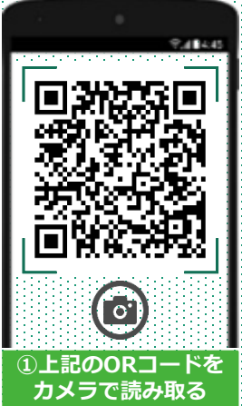
①上記のQRコードをカメラで読み取る

20代の決断～若き管理者看護師はなぜ『在宅』を選んだのか～ 現役訪問看護師が語る訪問看護の魅力! 「なぜ20代で訪問看護師を志したのか」 そのきっかけと、在宅医療のもつ魅力についてお話しいただきました。