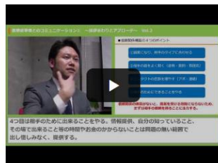
今すぐ実践！利用者様と信頼関係をきずく4つのポイント

実際の訪問の様子を動画で見ることができます！ 登録は簡単なので、是非のぞいてみて下さい。 あわーず独自の研修動画もアップしています！！