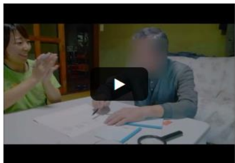
【言葉の訓練】絵を見て文章を答える

実際の訪問の様子を動画で見ることができます！ 登録は簡単なので、是非のぞいてみて下さい。 あわーず独自の研修動画もアップしています！！