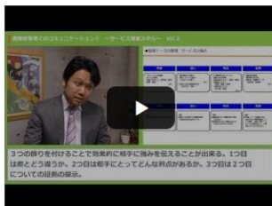
自社サービスの強みとは何？効果的に相手に強みを伝える方法

在宅医療の現場にいなければ分からないリアルな情報を“動画コンテンツ”にして随時配信していきます！