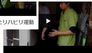
【訪問リハビリ】歩行練習