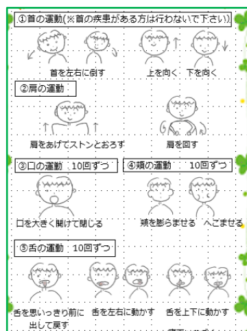
口腔器官の機能訓練