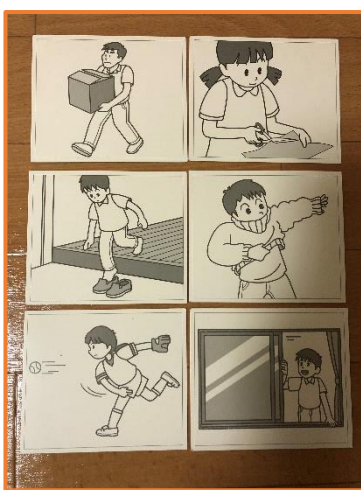
絵カードを使用した 理解、表出訓練 (短文)